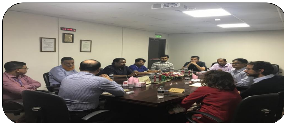
Imagen de la reunión mantenida por la delegación conjunta en la fábrica

El problema se había originado cuando en este centro de producción de la CS de Inditex se intentó constituir un sindicato 5 y la dirección de la fábrica no lo reconoció como tal. Inicialmente se plantearon ciertos problemas burocráticos para su establecimiento "formal", a partir de su registro en las oficinas del Ministerio de Trabajo, debido a problemas administrativos como razón o pretexto para no reconocerlo como contraparte para el desarrollo del dialogo social "normalizado".